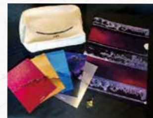
前期・後期 山鳥毛グッズセット (5名)