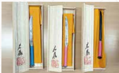
前期 刀匠スペシャルペーパーナイフ (3名)